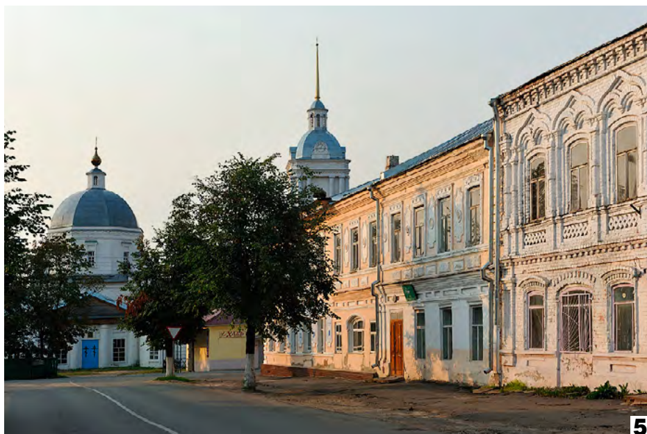
3 Историческая застройка г. Боровска, Калужская обл.